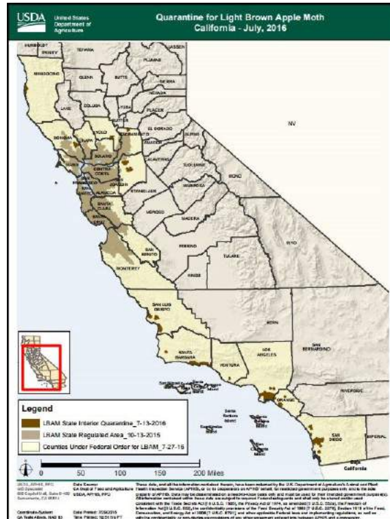
Figura 2. Condados con detecciones de Epiphyas postvittana en Estados Unidos (NAPPO, 2016).